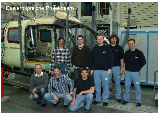
Das erfolgreiche Projektteam