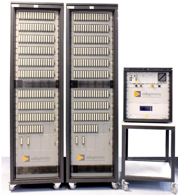
Testsystem NT 830 für den Teststand EC 145 T2