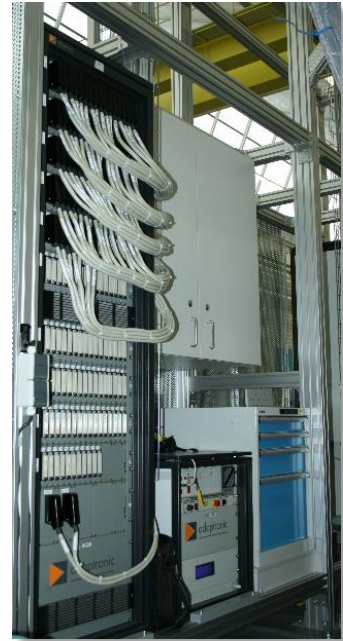
Integriert im Prüfstand