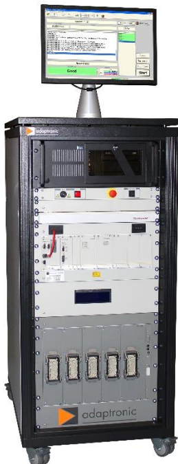
Testsystem NT 730