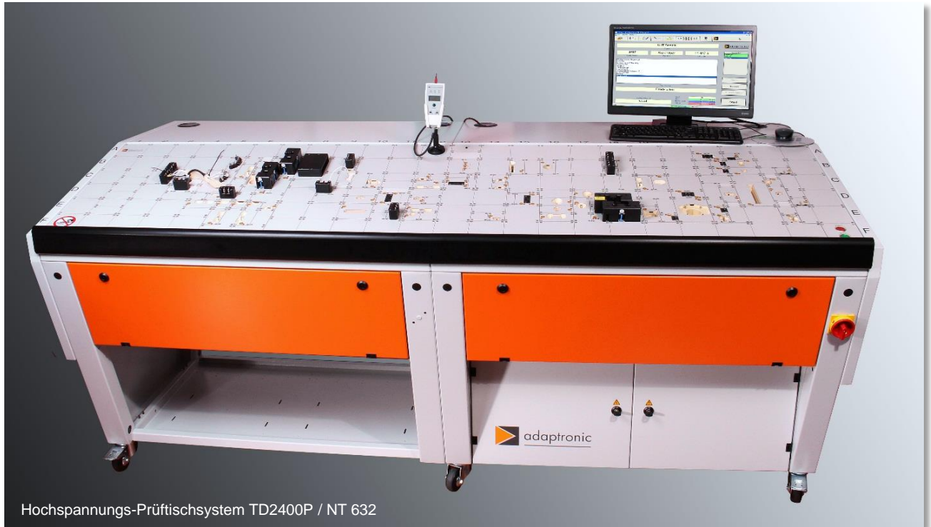
Hochspannungs-Prüftischsystem TD2400P / NT 632